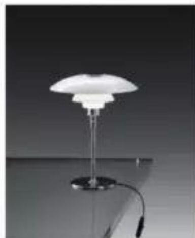
PH 4/3 Glass Table (1927)