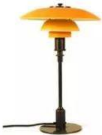
Table lamp (1927)