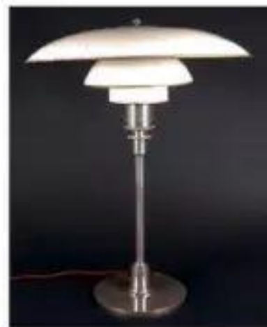
Desk lamp (1927)