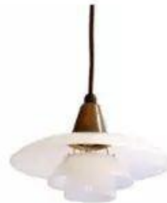
Glass pendant (1930's.)