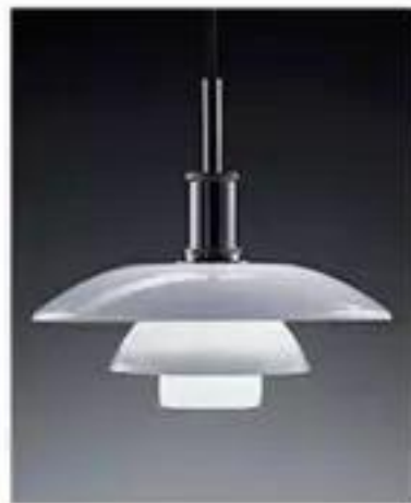
PH 2/1 Pendant (1926)