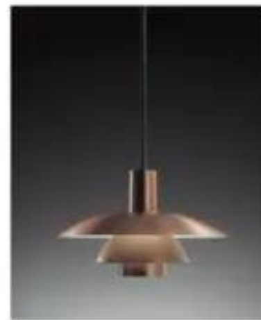
PH 4 Copper (1926)