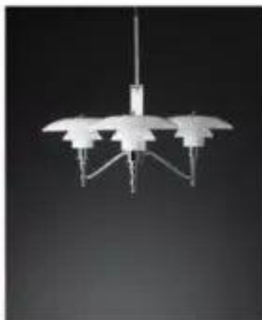
PH 3/2 Academy (1928)

PH 3 / 2 创造了一个和谐而自由的照明效果。把中心光源放置在螺旋形的焦点中，然后在螺旋上绘制色彩