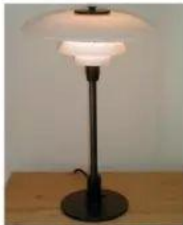
PH 4 Lamp (1928-33)

PH 3 / 2 创造了一个和谐而自由的照明效果。把中心光源放置在螺旋形的焦点中，然后在螺旋上绘制色彩