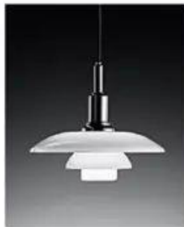
PH 3/2 (1926)