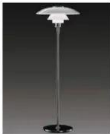
PH 4/3 Glass Floor (1927)