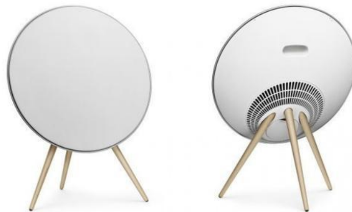
B&O公司的视听系列产品