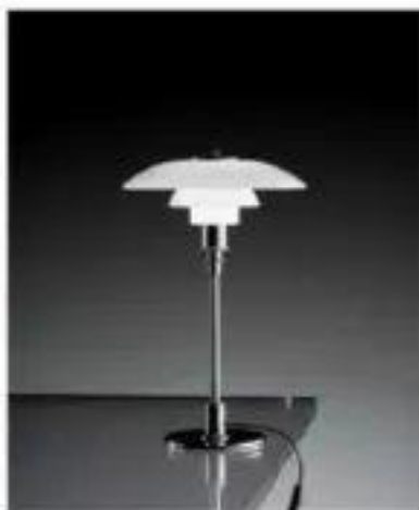
PH 3/2 Table (1927)