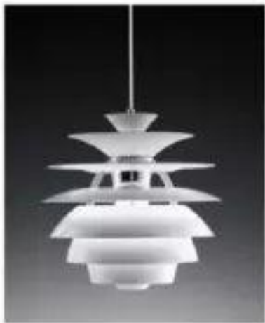
PH Snowball I (1924)