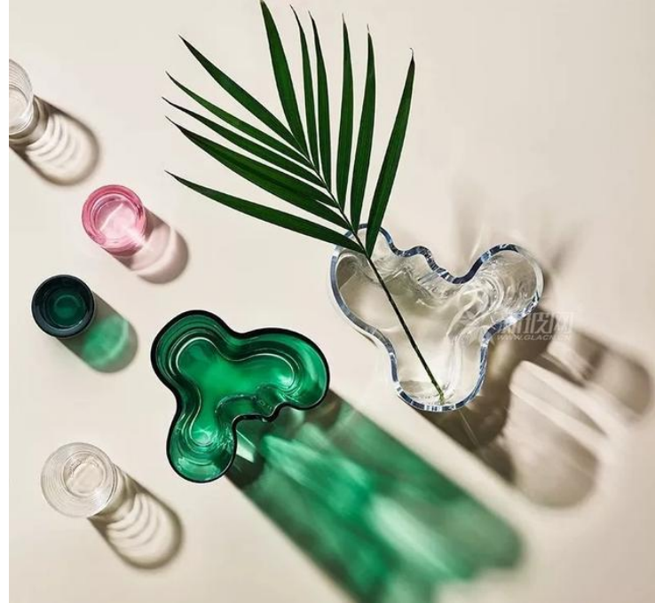
北欧风格芬兰传奇湖泊花瓶， Alvar Aalto 1963年设计

这是一款来自芬兰的湖泊玻璃花瓶，是设计大师阿尔瓦·阿尔托最著名的设计，它的灵感来自于芬兰蜿蜒的湖泊曲线。